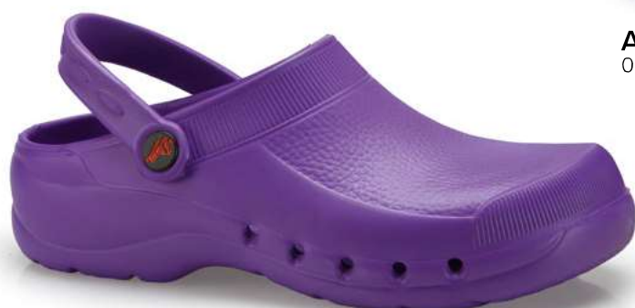
Art. 544/L 597 Lilla / Lilac