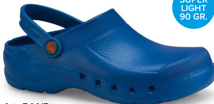
Art. 544/B 004 Blu / Blue