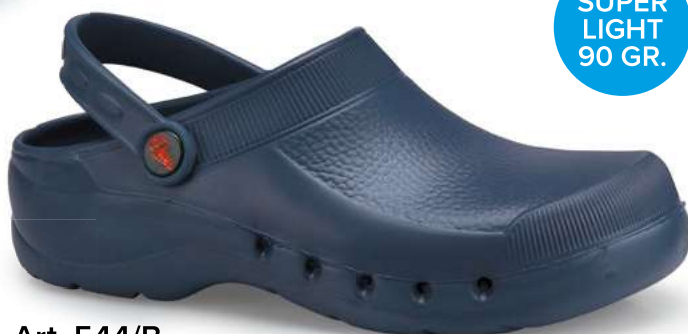
Art. 544/B 857 Blu notte / Navy Blue