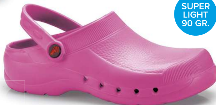
Art. 544/R 011 Rosa / Pink