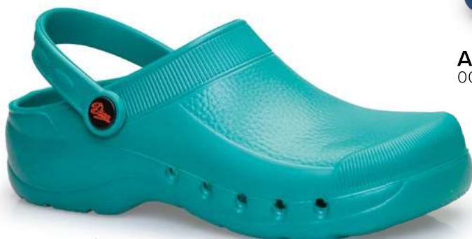
Art. 544/V 002 Verde / Green